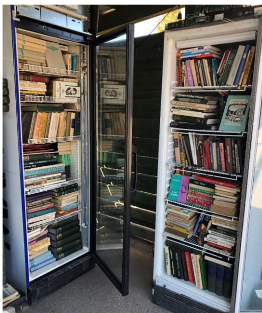
10.att. Grāmatu apmaiņas skapis

Līdzās Krāmu kambarim SIA "Liepājas RAS" kopš 2013. gada izveidojis grāmatu maiņas punktu, kurā nonāk makulatūrai paredzētās grāmatas, kas ir labā stāvoklī. Aprites ekonomikas veicināšanai grāmatu skapji ir izvietoti nolietotos ledusskapjos ar stikla durvīm, kas ļauj ērti pārlūkot tā saturu ( sk.10.att.). Skapji ir brīvi pieejami šķirošanas laukuma apmeklētājiem, kas veicinājis tā pastāvīgo apmeklētāju nodrošināšanu. Ik mēnesi skapjos tiek apmainītas vidēji 200-300 grāmatas.