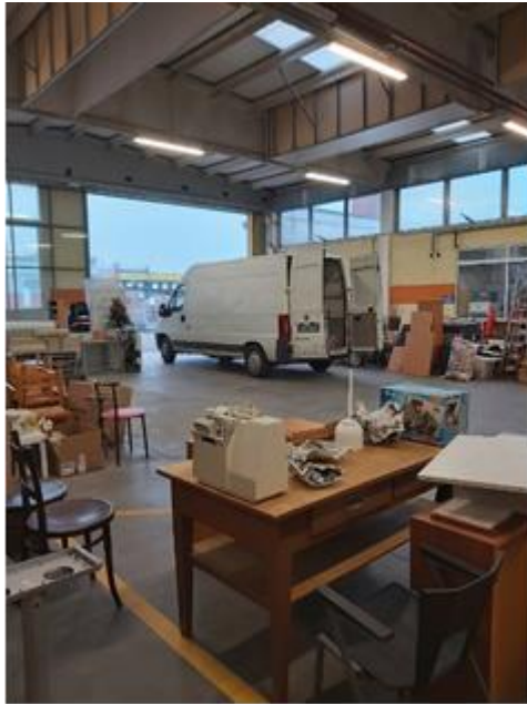
4. att. Preču pieņemšanas un novērtēšanas vieta veikalā "Officina 68" Ferrārā.

Lielo centru izveidei un darbībai ir izteikti sociāls aspekts. Tā izmaksas ir tieši saistītas ar īrējamo telpu izmaksām, infrastruktūras - siltuma un elektrības cenu, vidējo darbinieku algu; darbinieku skaitu un to nodarbinātības pakāpi, kā arī nepieciešamā tehniskā nodrošinājuma izmaksām. Itālijā daļēji to sedz valsts – ka sabiedrisku aktivitāti, iesaistot bezdarbniekus, kā arī papildus ienākumi tiek gūti no preču realizācijas. Novērtējot pārdošanai izliktās preces, tās ir augstas kvalitātes, bet par vidējām vai zemām cenām..