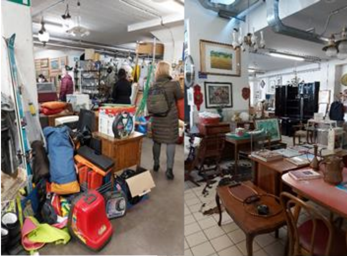
2. att. Veikala pagrabstāvs un tirdzniecības zāle "Piazza Grande" Boloņā.

Lietoto preču veikalā " Officina 68 " Ferrārā. iepirkšanās galvenokārt notiek tiešsaistē. Veikalā strādā 18 darbinieki. Veikala telpas tiek nomātas (3.attēls). Iepriekš šeit bijis bērnu izklaides centrs. Ienākumi aptuveni 9000 EUR mēnesī. Uzņēmumam ir 3 dažāda izmēra transportlīdzekļi. Preču pieņemšanas un novērtēšanas vietas (4.attēls) labajā pusē novieto mantas, kas ir nederīgas lietošanai un kuras paredzēts nogādāt uz šķirošanas laukumu. Derīgās lietas, kam nepieciešams remonts, meistari labo uz vietas. Katru pieņemto lietu marķē pēc tā, kas to nodod. Pēc tam nofotografē, aizpilda veidlapu, kurā norāda visu informāciju par lietu. Kopā ir 4 veidlapas, kas jāaizpilda.