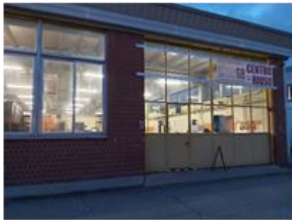
3. att. Lietoto preču veikals " Officina 68 " Ferrārā.

Lietoto preču veikalā " Officina 68 " Ferrārā. iepirkšanās galvenokārt notiek tiešsaistē. Veikalā strādā 18 darbinieki. Veikala telpas tiek nomātas (3.attēls). Iepriekš šeit bijis bērnu izklaides centrs. Ienākumi aptuveni 9000 EUR mēnesī. Uzņēmumam ir 3 dažāda izmēra transportlīdzekļi. Preču pieņemšanas un novērtēšanas vietas (4.attēls) labajā pusē novieto mantas, kas ir nederīgas lietošanai un kuras paredzēts nogādāt uz šķirošanas laukumu. Derīgās lietas, kam nepieciešams remonts, meistari labo uz vietas. Katru pieņemto lietu marķē pēc tā, kas to nodod. Pēc tam nofotografē, aizpilda veidlapu, kurā norāda visu informāciju par lietu. Kopā ir 4 veidlapas, kas jāaizpilda.