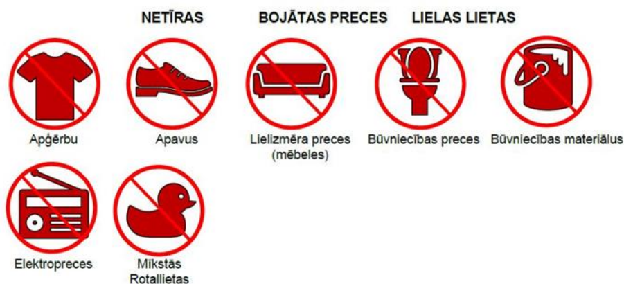
7.att. Lietas, kas Krāmu kambarī netiek pieņemtas

Lai veiktu uzskaiti, atņestās un paņemtās lietas katrs apmeklētājs reģistrē anketā (8.attēls). Anketas reizi mēnesī tiek apkopotas un rezultāti ierakstīti reģistrā (3.tabula).