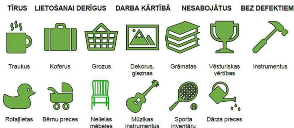
6.att. Apmaiņai nododamās lietas Krāmu kambarī