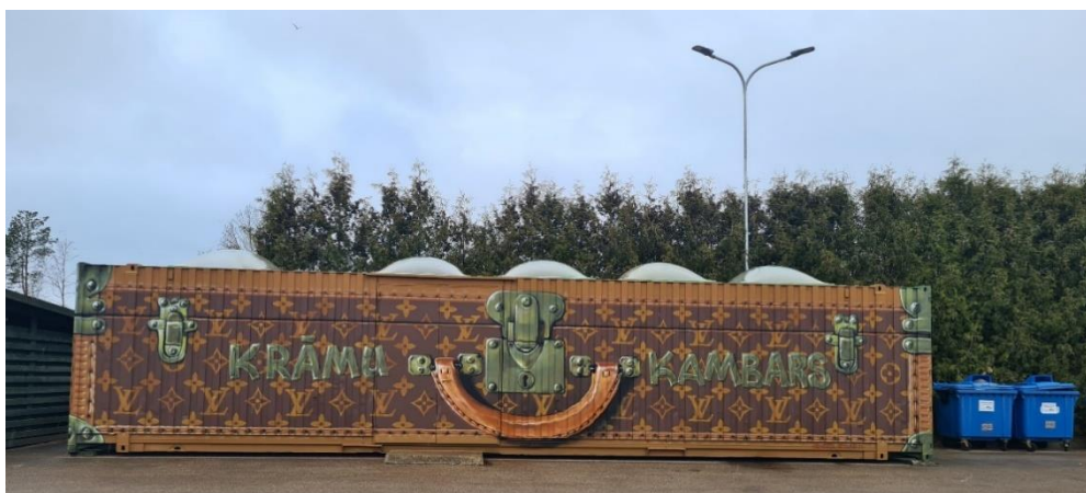
5.att.Krāmu kambarā sadzīves atkritumu poligona “Ķīvītes” teritorijā

Tieši tāpat šajā šķirošanas laukumā iespējams nodalīt arī lietošanai derīgas un labā stāvoklī esošas sadzīves lietas, kuras ievietojamas SIA “Liepājas RAS” izveidotajā mantu apmaiņas centrā Krāmu kambarā (sk.5.att.).