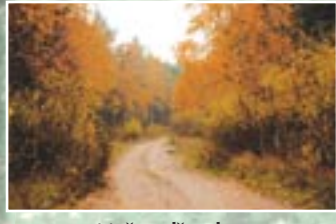
Meža ceļš rudenī