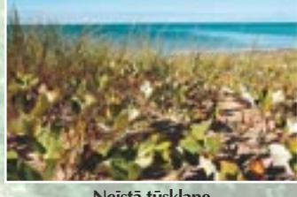
Neistā tūsklape ( Petasites spurius )

Krasta posmā starp Ziemeļpē un Akmeņragu ir izveidojušas daudzveidīgas pelēkās kāpas. Tās redzamas gan virs stāvkrastiem, gan arī starp priekškāpām un mežu. Vietās, kur pelēkās kāpas ir vecākas un smilšu kustība pierimusi, augāju veido ķērpji, sūnas, zemi sauso pļavu un kāpu augi. Tur līdzās aug divmāju kakpēdiņa, jūrmalas pārkoņamoliņš, smiltāja nelķe un pūsmēness ķekarparade. Taču pelēkajās kāpās, kuras pakļautas periodiskai smilšu pārpūšanai, vairāk