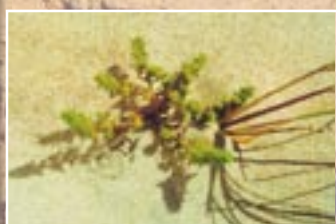
Kālija sālszāle ( Salsola kali )