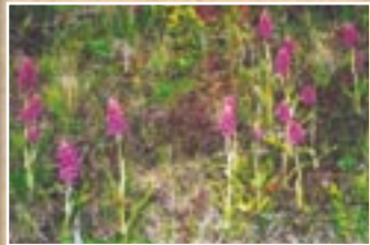
Stāvlapu dzegužpirkstīte ( Dactylorhiza incarnata )