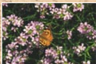
Baltijas šķēpene ( Cakile baltica )