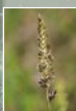
Zilganā kelērija ( Koeleria glauca )