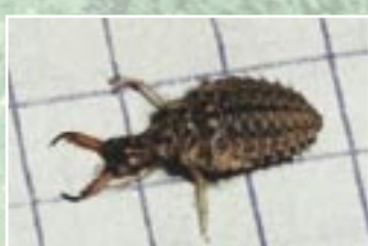
Skudrlauvas ( Myrmeleon formicarius ) kāpurs