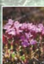
Mārsils ( Thymus )