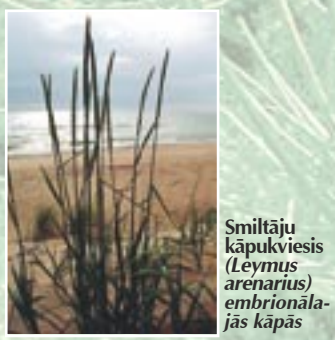
Smiltāju kāpukviesis ( Leymus arenarius ) embrionālās kāpās