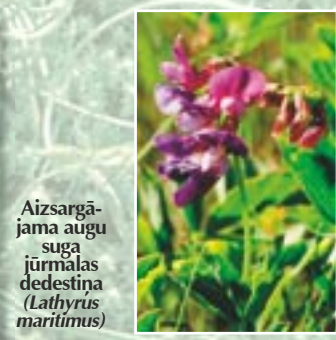
Aizsargājama augu suga jūrmalas dedestīna ( Lathyrus maritimus )