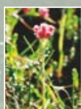
Divmāju kakpēdiņa ( Antennaria dioica )