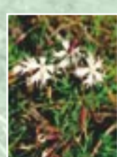
Smiltāja nelķe ( Dianthus arenarius )