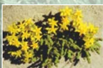
Kodīgais laimīšs ( Sedum acre )