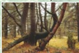
Vecās priedes ir dzīvesvieta retām dzīvnieku sugām