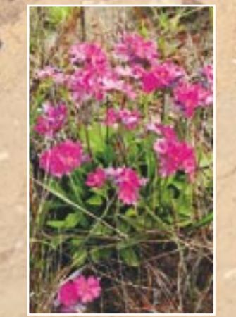
Bezdelīgactiņa ( Primula farinosa )

Jūras piekraste Ziemeļpē ir ļoti neparasta. Te redzami krasti, kādu nav nekur citur Latvijā. Pie jūras iepreti Ziemeļpē baznīcai pludmale robežojas ar stāviem noskalošanas krastiem. To augstums svārstās no 5 līdz 12 metriem. Pēdējo gadu laikā jūra sauszemei dažviet atņēmusi vairāk kā 10 metrus platu joslu. Vietām vēl šobrīd turpinās krasta nogrūvumi. No Tenkšu grāvja uz ziemeļiem noskalošana nav tik aktīva un tāpēc stāvkrasts apaudzis ar augiem. Maijā krasta rotā bezdelīgactiņas, jūnijā tur redzamas bagātīgi ziedošu orhideju audzes (dzegužpirkstītes), kā arī parastās kreimules un citi kalnainu vietu augi. Šādas augu sabiedrības jūras krastā Latvijā ir ļoti reti sastopamas. Tas saistīts ar īpašajiem augšanas apstākļiem: zilā māla stāvkrastā iztek avoti, nodrošinot gan mitrumu, gan arī barības vielas. Tālāk uz Žožu pusē, kur jūras krasts periodiski tiek noskalots, saaugušas māllepēs, dažādi kāpu un pļavu augi. Stāvkrastā mājvietu iekārtojušas krasta čurkstes.