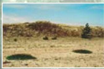
Spilvenveida augājs pelēkajā kāpā