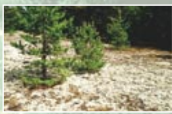
Pelēkā kāpa ar ķērpjiem