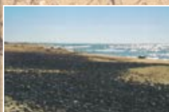
Pludmale ar oļiem

Visbiežāk Ziemeļpē pludmalē sastopama Baltijas šķēpene. Tas ir viengadīgs augs ar pārveidotām, sulīgām lapām un sārti violetiem, smaržīgiem ziediem. Nereti šķēpenei līdzās aug kālija sālszāle, kurai arī ir pārveidotas lapas, tikai ar dzeloni galā. Gan šķēpene, gan kālija sālszāle ir halofīti - augi, kas spēj augt sāļās augsnēs.