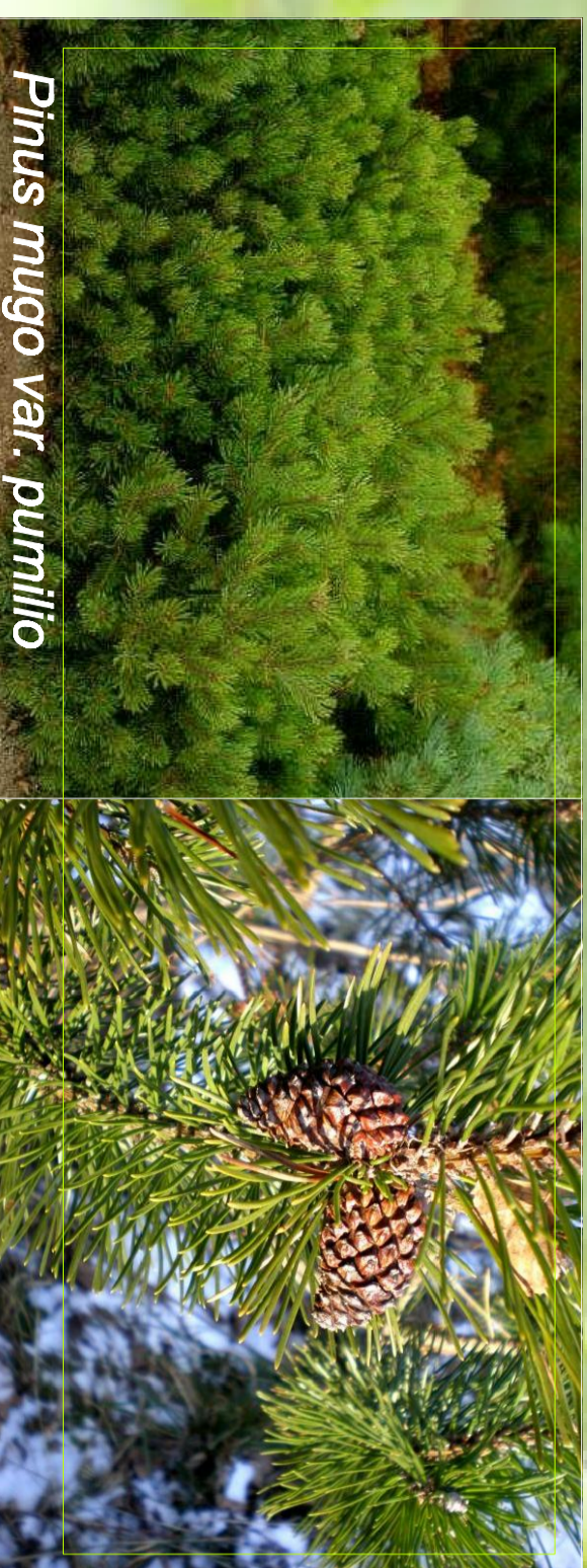
Pinus mugo var. pumilio

Savajā sastopama Viduseiropā un Balkānu pussalās kalnos, Ziemeļu un Centrālās Apenīnos. Vainags parasti ir krūmveida ar izločiem stumbriem vai pat klājenisks. Auga augstums nepārsniedz 5m, labi pakļaujas veidošanai. Skujas tumši zaļas, sakārtotas pa 2. Zied maija vai jūnijā sākumā. Čiekuri 2-4,5cm garī, kanēļbrūni.