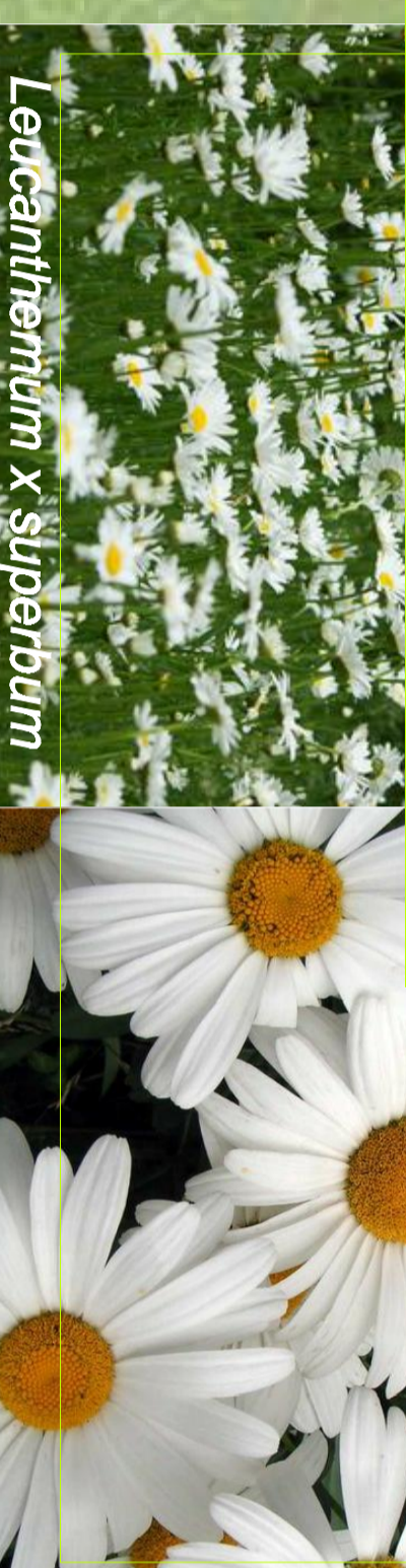
Leucanthemum x sibpatium

Tautā sauc arī par milzu pīpeni jeb margrietīgu. Parastā pīpene ļoti bieži sastopama Latvijas pļavās, laukos, mežos, ceļmalās.