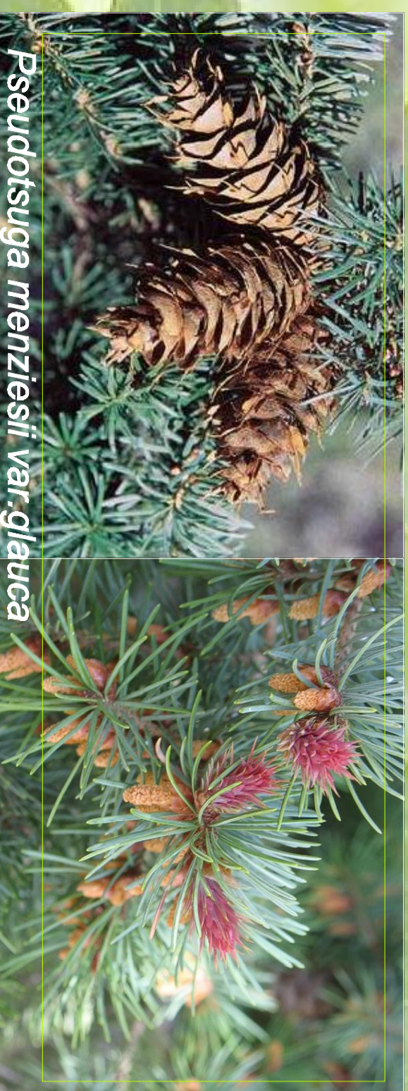
Pseudotsuga menziesii var. glauca

Savajā sastopama Ziemeļamerikas rietumos - Klīnšu kalnos. Neliela auguma koks ar konisku vainagu. Skujas zilganas, čiekuri dekoratīvi.